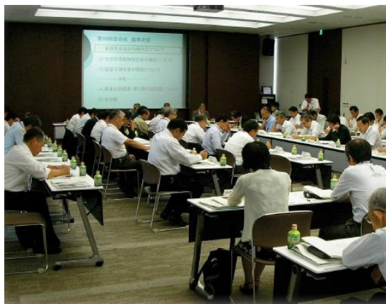
印旛沼流域水循環健全化会議の様子