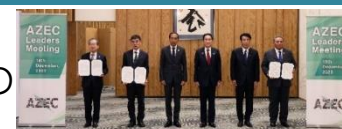
共同声明記念撮影