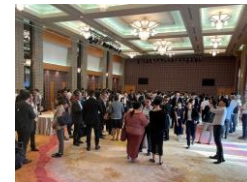
太平洋島嶼国における社会課題解決型ビジネス展開支援イベント（2023年7月）