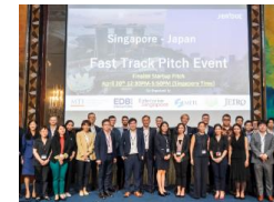
日シンガポール・ファストトラック・ピッチ(2023年4月)