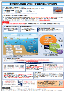
展示したポスターの一例

我が国の豊かな再生可能エネルギーをはじめとする海洋資源の利活用に関する展示会であり、海洋に関する専門家、業界関係者が一堂に会する海洋ビジネスのプラットフォーム。 これまで海洋産業技術展として個別に開催されていたが、今回からエネルギー・イノベーション総合展の一つとして開催され、様々な分野の来場者が横断的に講演聴講や展示を見学。